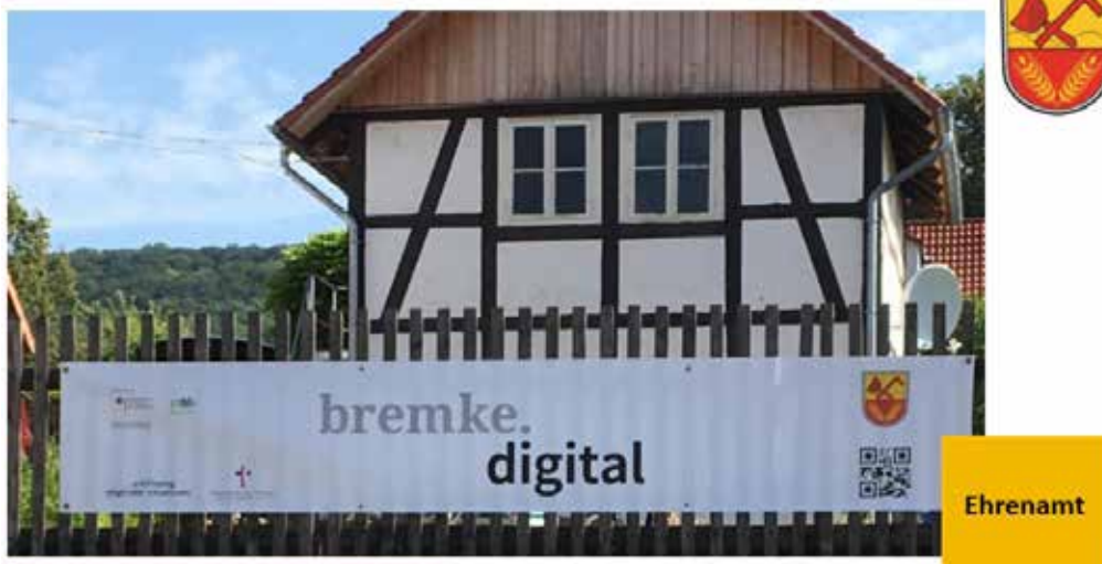
Abbildung 2: Impression aus Bremke

ehrenamtliche Arbeit organisieren. Die Planung des nächsten Gemeindebriefs der Kirche kann darüber laufen und in der Nachbarschaft kann Unterstützung für die Gartenarbeit ebenso gesucht und gefunden werden wie übriges Obst aus dem eigenen Garten zum Verschenken angeboten werden kann.