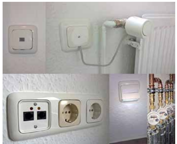
Abbildung 4: BASIS – Building Automation durch ein Skalierbares & Intelligentes System

Mobilität, Aktivität, Schlafparameter, Gerätenutzung, Umgebungsdaten