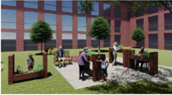
Abbildung 5: Entwurf „Höhenverstellbares Hochbeet“

Überzeugt hat die Jury letztlich ein höhenverstellbares Hochbeet. Das Beet ist mechanisch verstellbar. Es ist das einzige Beet, das für jedes Alter und jede Größe geeignet ist. In einem Moment kann eine Person im Rollstuhl die Fläche bepflanzen und gleich danach ein Kind das Beet herunterkurbeln und die neuen Pflanzen gießen. Dadurch bietet das Beet die Möglichkeit verschiedene Generationen zu verbinden.