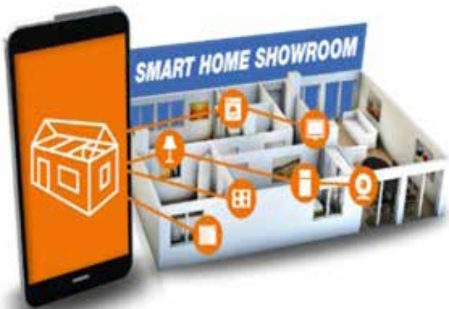
Abbildung 3: Schematische Darstellung des Smart Home-Konzepts